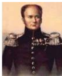
Александр Павлович Романов, 1801 – 1825 г

Боковая поверхность (гурт): Нанесена сетка. Края монеты неровные.