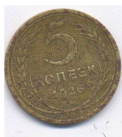
1926г., диаметр 25,0 мм, масса 5,0г.