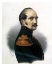
Николай Павлович Романов, 1825 – 1855г