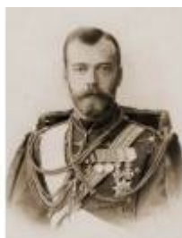
Николай II, 1894 – 1917