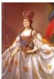
Екатерина II, 1762 – 1796г