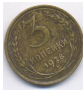
1928г., диаметр 22,0 мм, масса 3,0г.