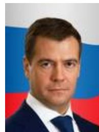
Д.А. Медведев, с 2008г