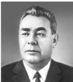
Л.Брежнев, 1964 – 1982

Штемпель оборотной стороны: в середине монетного поля номинал, написанный в две строки: "1 рубль", под ним дата - 1964. По бокам венок, верхнюю часть которого составляют колосья, нижнюю - дубовые листья, соединенные внизу декоративной ракушкой.