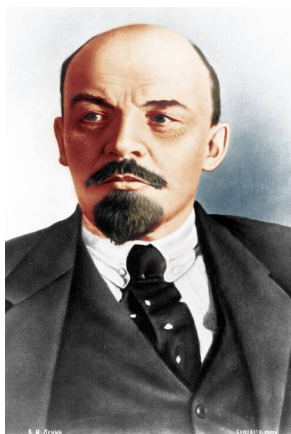
В.И. Ленин, 1917 – 1924г