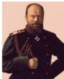
Александр II, 1855 – 1881г